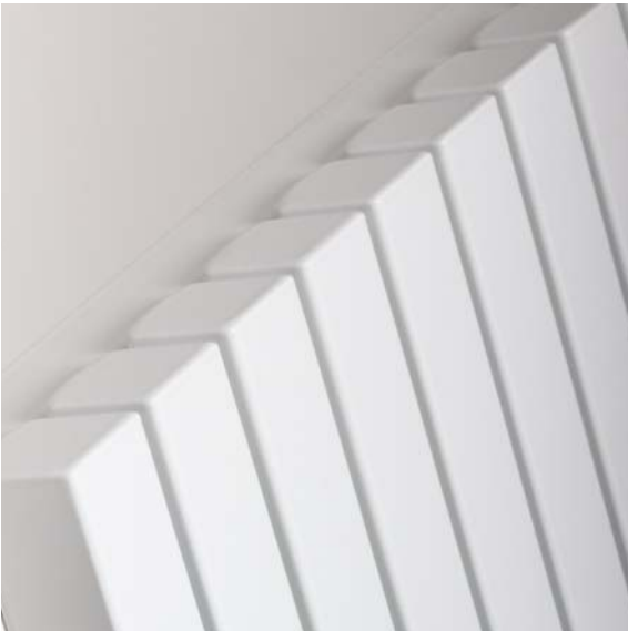
TETRA traffic white 333

Tetra łączy grube kwadratowe profile grzewcze w jeden stylowy grzejnik. Tetra charakteryzuje się bardzo wysoką wydajnością cieplną. To jakość firmy Jaga połączona z klasycznym wzornictwem.